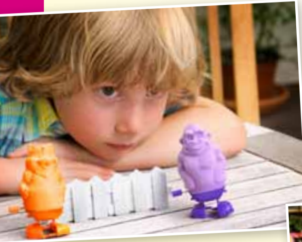
Die lustigen Tiere aus dem „Magic Zoo“ können sogar laufen. (UVP 24,99 €)

Kinder lieben es, lustige Figuren zu kneten. Dabei fördern sie ganz spielerisch ihre Feinmotorik, Konzentration und Kreativität. Für Eltern und Erzieher ist Knete jedoch häufig mit Arbeit verbunden: eingetrocknete Knete muss wieder weich gemacht werden und aus Kleidung und Teppichen ist sie oft nur schwer zu entfernen.