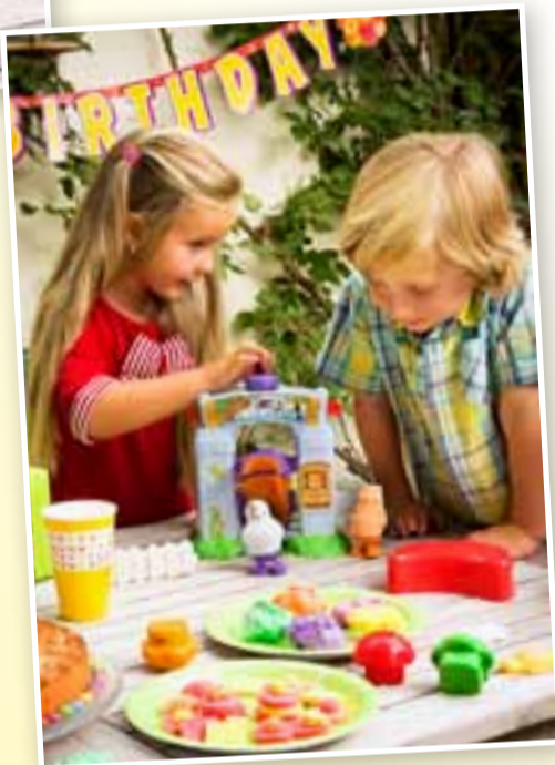
Moon Dough begeistert Jungs und Mädchen. Einzelpacks sind ab 3,99 € (UVP) erhältlich.

Durch die ausgefeilte Rezeptur bleibt der Modellerspaß auch nach vielfachem Gebrauch geschmeidig und trocknet auch unverpackt nicht aus. Und natürlich kann man mit den hergestellten Figuren auch perfekt spielen, da sie zwar weich, aber formbeständig sind. Diese geniale Beschaffenheit macht Moon Dough zu einem echten Dauerbrenner in KITAs und Kinderzimmern.