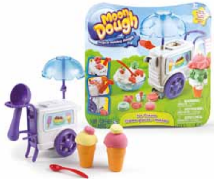
Für kleine Eisverkäufer: Das große Spielset „Eiswagen“. (UVP 14,99 €)

Das innovative Neuprodukt überzeugt neben einzeln erhältlichen Packungen in verschiedenen Farben mit thematischen Spielsets, die Kinder in unterhaltsame Fantasiewelten mitnehmen. Da werden die Kleinen zu Eisverkäufern oder bereiten das Frühstück zu. Und mit dem Magic Zoo können Kinder die Knetmasse sogar mühelos in süße Bären, Pinguine oder Affen verwandeln, die auf kleinen Kunststofffüßchen umherlaufen. Dazu füllen sie Moon Dough ganz einfach in die entsprechende Vorrichtung des Sets und drehen an der integrierten Kurbel – schon kommt ein fröhliches Tier herausmarschieren. Bereits die